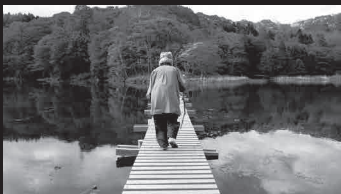
安田 葉 《WIND BIRDS》映像、約 15 分 2018 年