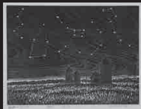
能登 正智《勇拂のサイロ》木版 1988 年 当館蔵