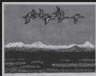
能登 正智《弁天沼》木版 1988 年 当館蔵