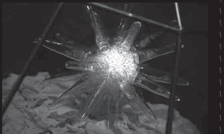
安田 葉 《予告の種》（部分）ガラス、LED など 2014 年 作家蔵（参考作品）