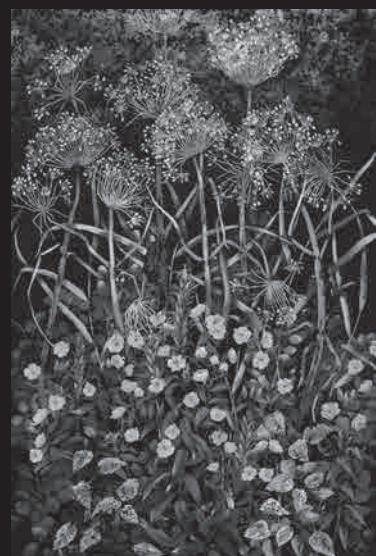
馬場 静子《くさむら》紙本彩色 1994 年 当館蔵